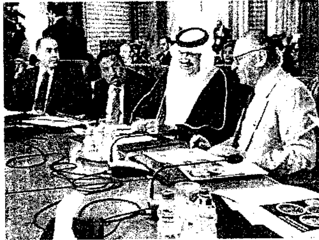
الجلسة 17 أبريل - 2018

تم وفد جمعية البرية الأثرية في أعمال الاجتماع الكشفي للبرلمانيين لجمعية البرية الأثرية لبحث وتقديم استراتيجية جديدة على الشباب العربي لتشجيعهم بشكل أوسع في العمل الكشفي، بحضور د. الهادي بنومي حلفاء وزير حج وشؤون pellegrin في الاتحاد الأثرية لجمعية البرية في البحرين، من التواجد المشيوق الحشدة من لمتحدثين من كافة مناصب الجمعية.